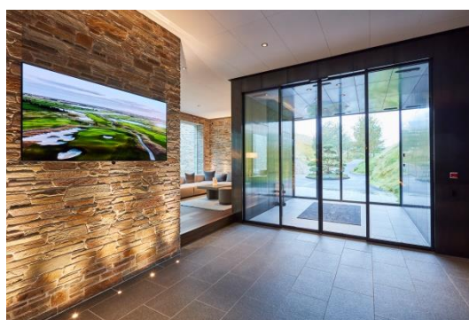
Sirsniņgs sveiciens: GEZE durvju sistēmas laipni gaidīti viesi Great Northern Dānijā.

Visas iekšējās bīdāmās durvis, tostarp virtuvē un restorānā, kā arī ārējās un verandu durvis uz spa un kluba ēku, arī ir aprīkotas ar GEZE automātiku. Lai saglabātu moderno dizainu, arhitekts noteica, kāda bīdāmo durvju automātika jāuzstāda griestos. GEZE ir vienīgais piegādātājs tirgū, kas ir izstrādājis bīdāmo durvju automātiku integrētām, pilnībā stiklotām sistēmām.