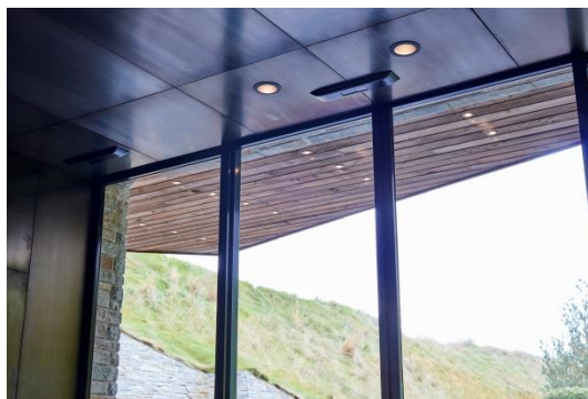
Diskrēts risinājums: GEZE durvju automātika ir integrēta durvju rāmī.

“GEZE integrētie durvju aizvērēji ir mazākie un ar labāko konstrukciju tirgū, un tie lieliski atbilst Great Northern viesnīcas vajadzībām.