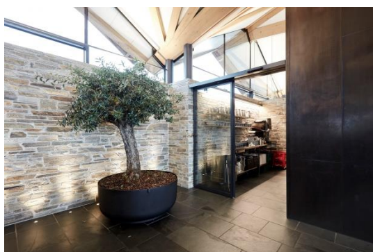
Great Northern visi elementi ir pilnīgā harmonijā viens ar otru – no akmens sienām un koka paneļiem līdz bīdāmām stikla durvīm ar diskrētu GEZE durvju sistēmu.