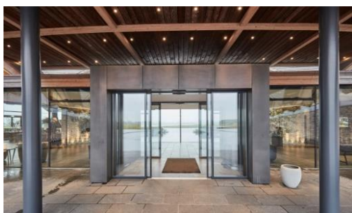
GEZE IGG integrētā, pilnībā stiklotā sistēma ieejas durvīs.

Great Northern ēkas atklāj estētisku dimensiju, kas piedāvā ziemeļnieciska, moderna arhitektūra ar globālu sajūtu, ko rada ar rokām grebti smilšakmeņi no Grieķijas un kokmateriāli no Āfrikas. Materiālu, piemēram, gaišā smilšakmens, tumšās koksnes, siltā toņa vara un stikla, izvēle atbalsta pirmatnēju un organisku dabas izpausmi, kas aptver Great Northern.