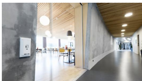
Pilnīga pieejamība Musholmas centrā

Arī Dānijas tirgū strādāja vietējie darbinieki. Pirmie 3 darbinieki uzsāka darbu 2003. Gadā, un drīz vien tika izveidots GEZE Dānijas birojs. Vietējā darbaspēka pieaugums palielināja procentuālo izaugsmi tirgū. Lai gan ikdienas pārdošanai izplatītājiem bija liela loma stratēģijā, uzmanība drīz vien tika pievērsta arī projektiem. GEZE kļuva par uzticamu